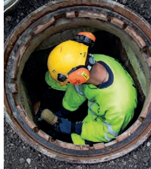
^ Lavori nel pozzetto d'ispezione: lo spazio è limitato.

Oltre al lavoro nei cantieri, i costruttori stradali svolgono altri compiti. Si occupano ad esempio della manutenzione delle diverse macchine, soprattutto in inverno, quando il tempo condiziona il lavoro all'aperto.